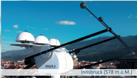
Innsbruck (578 m.ü.M.)