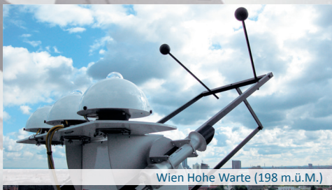
Wien Hohe Warte (198 m.ü.M.)