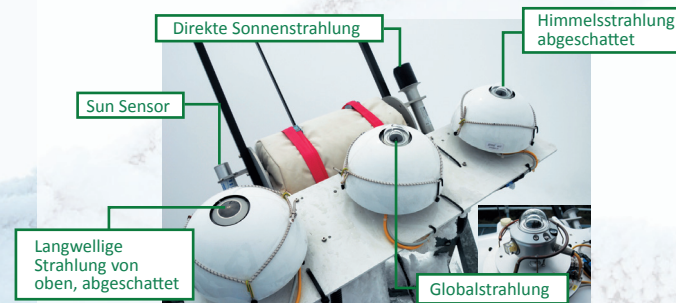
Abbildung 2: Typische ARAD Station: Sonnenfolger mit den verschiedenen Strahlungsmessgeräten.

Die Sensoren sind auf einem Sonnenfolger montiert, der einerseits für die exakte Nachführung entsprechend der Sonnenbahn sorgt und damit die kontinuierliche Ausrichtung des Pyrheliometers zur Messung der direkten Strahlung sicherstellt und andererseits der permanenten Abschattung des Pyranometers zur Messung der diffusen Strahlung und des Pyrgeometers zur Messung der Wärmestrahlung dient.