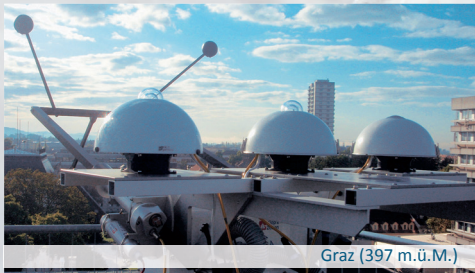
Graz (397 m.ü.M.)