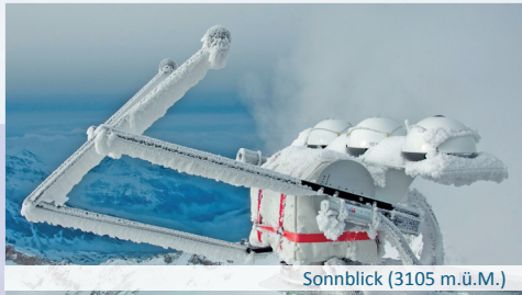
Sonnblick (3105 m.ü.M.)