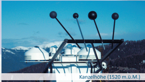
Kanzelhöhe (1520 m.ü.M.)